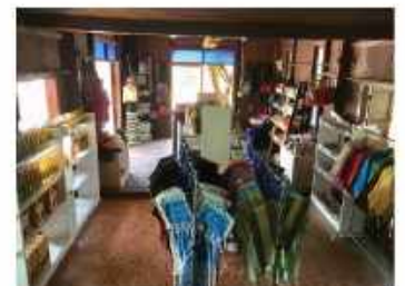
#รวมของดีเมืองแม่ฮ่องสอน

หรือสั่งซื้อได้ที่ www.facebook.com/hedkorleawOTOP บริการจัดส่งทั่วประเทศ