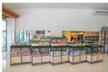
#บรรยากาศเป็นกันเอง