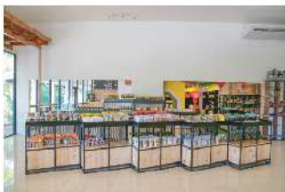
#บรรยากาศเป็นกันเอง