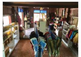
#รวมของดีเมืองแม่ฮ่องสอน

หรือสั่งซื้อสินค้า ได้ที่ www.facebook.com/hedkorleawOTOP มีบริการจัดส่งทั่วประเทศ