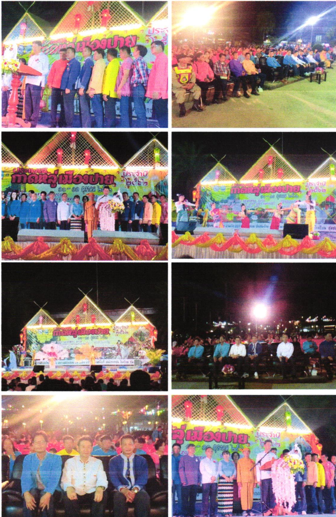
ภาพสรุปผลการดำเนินงานตามโครงการอนุรักษ์ ส่งเสริมศาสนา ศิลปวัฒนธรรม จารีตประเพณี และภูมิปัญญาท้องถิ่น ภายใต้กิจกรรม “ประเพณีกาตหู่เมืองปาย” ประจำปี ๒๕๖๒